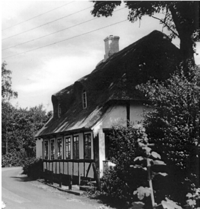
”Lærkenborg” Østerhusevej 19